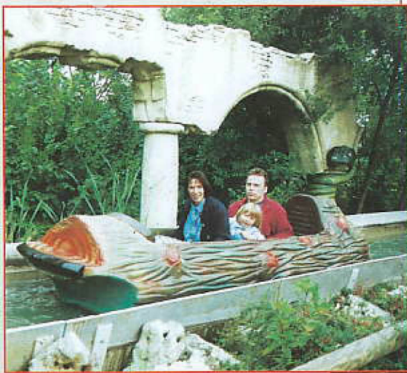
Walibi - Metz (57)