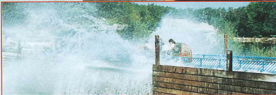
Fraispertuis City (88)